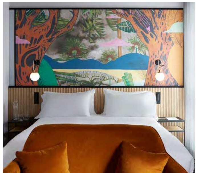
Drawing House, chambre deluxe avec l'œuvre d'Alexandre et Florentine Lamarche-Ovize, Élisée, une géographie (Colombie) , Paris, 2022