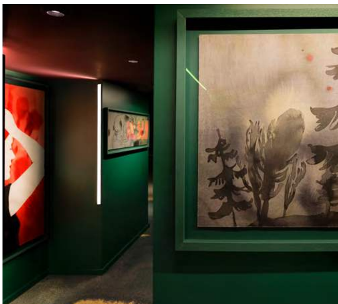
Drawing Hotel, couloir du 4 e étage avec l'œuvre Derrière les paupières de Françoise Pérovitch, Paris, 2017