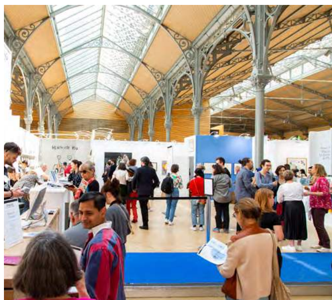
Drawing Now Art Fair, 15 e édition, Carreau du Temple, Paris