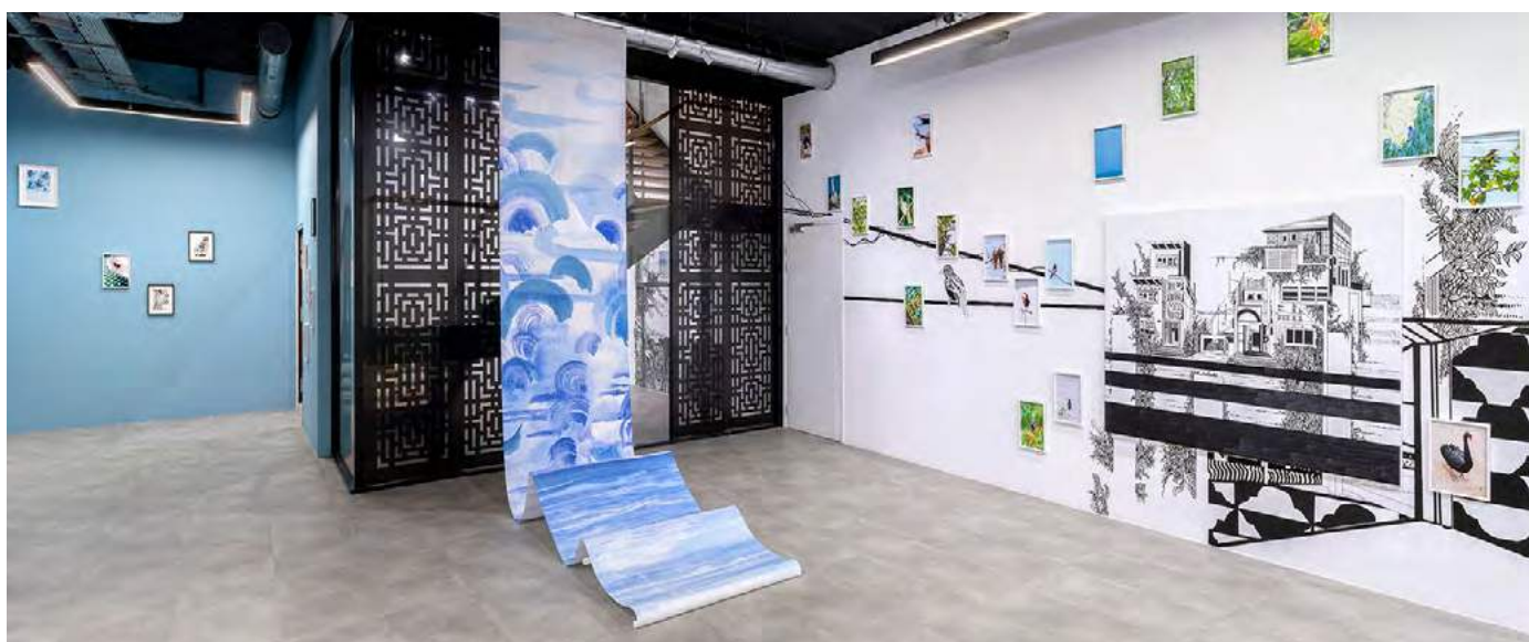
Exposition I See a Bird / Je vois un oiseau de l'artiste Chourouk Hriech, commissaire Jérôme Sans, 2022, Drawing Lab, Paris

Le Drawing Lab accueille également l'exposition de l'artiste lauréat du Prix Drawing Now, remis lors de Drawing Now Art Fair, le salon du dessin contemporain. Depuis 2022, la formule